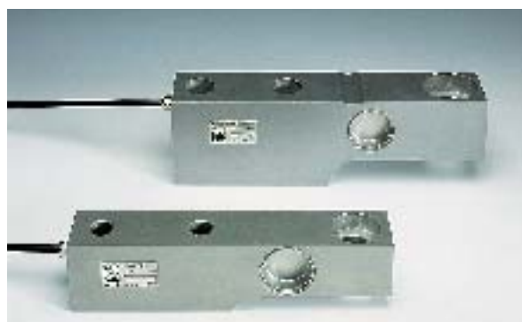
Cella di carico inox con grado di protezione IP67