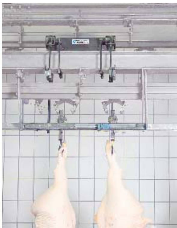
Pesatura automatica in una linea di macellazione