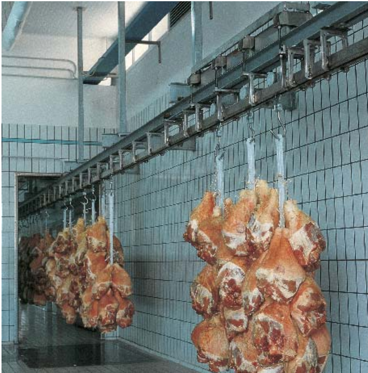
Pesetta aerea AR-TC installata in un reparto ricevitore prosciutti di un moderno salumificio